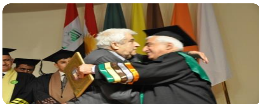
سه رۆکی زانکۆ پیرۆزبایی له د.عیزه دین ده کات